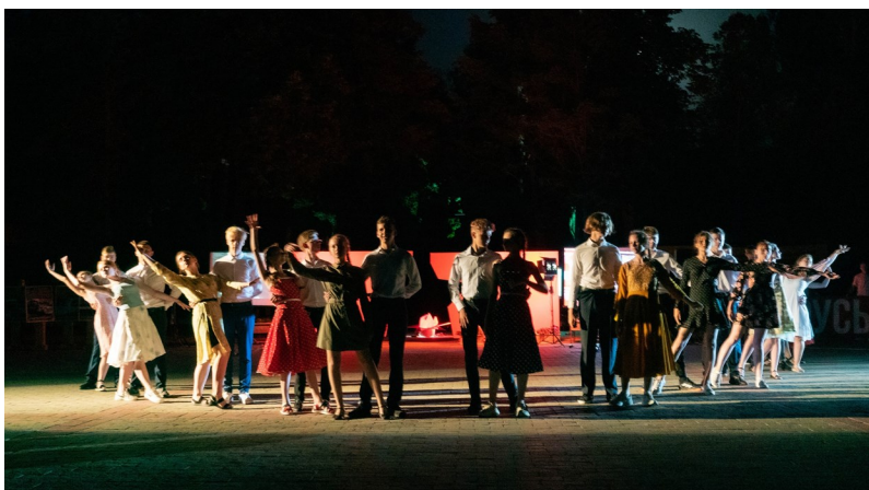
Танцевальный номер «Довоенный вальс»

Ведущий. Итого 2600 километров – это если считать по прямой. Кажется мало, правда? Самолетом примерно 4 часа, а вот перебежками и по-пластунски – 4 года... 1418 дней.