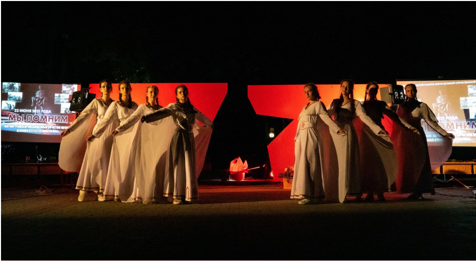
Танцевальная композиция «Журавли»

Маленький. Единственный... Белый свет не мил. Изболелась я. Возвратись, моя надежда! Зернышко мое, зорюшка моя. Горюшко мое, – где ж ты? Не могу найти дороженьки, чтоб заплакать над моги- лою... Не хочу я ничегошеньки – только сына милого. За лесами моя ластынька! За горами – за громадами... Если выплаканы глазыньки – сердцем плачут матери. Белый свет не мил. Изболелась я. Возвратись, моя надежда!