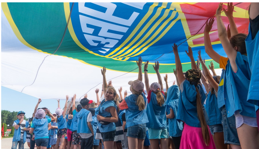
Вынос флага НДЦ «Зубренок»

Голос за кадром. Отряды, внимание! Под флаг учреждения образования «Национальный детский образовательно-оздоровительный центр «Зубренок» смиренно! Равнение на флаг! Флаг вынести! (Под торжественную музыку 12 воспитанников выносят флаг НДЦ «Зубренок», останавливаются в центре площади, воспитанники, стоящие в первом ряду, присаживаются, воспи-