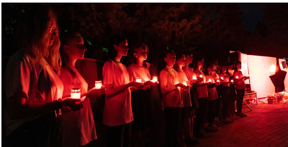
В память павших своих земляков зажигаем потухшие свечи