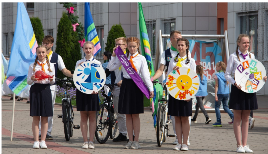
Реприза «Малые символы «Зубренка»

Ведущий. В центре эмблемы находится символ крылатой профессии вожатого, который изображен в виде костра, что говорит о том, что с детьми работают педагоги, в груди