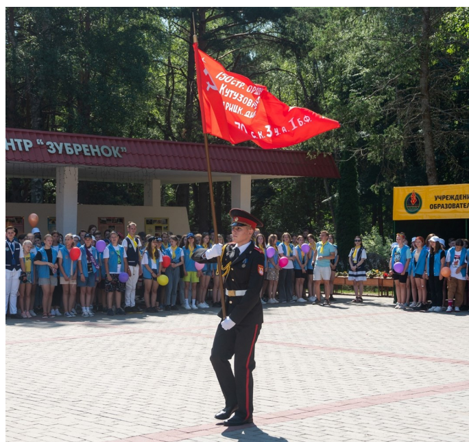
Вынос копии Знамени Победы

Ведущий. 3 июля 2010 года клубом военачальников Российской Федерации НДЦ «Зубренок» была передана копия Зна-