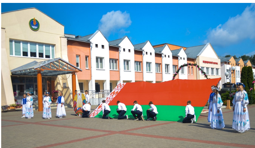
Вынос Государственного флага Республики Беларусь и изображения Государственного герба Республики Беларусь

Ведущий. В год народного единства символы нашей страны являются знаками незыблемости, национальных традиций и духовных ценностей.