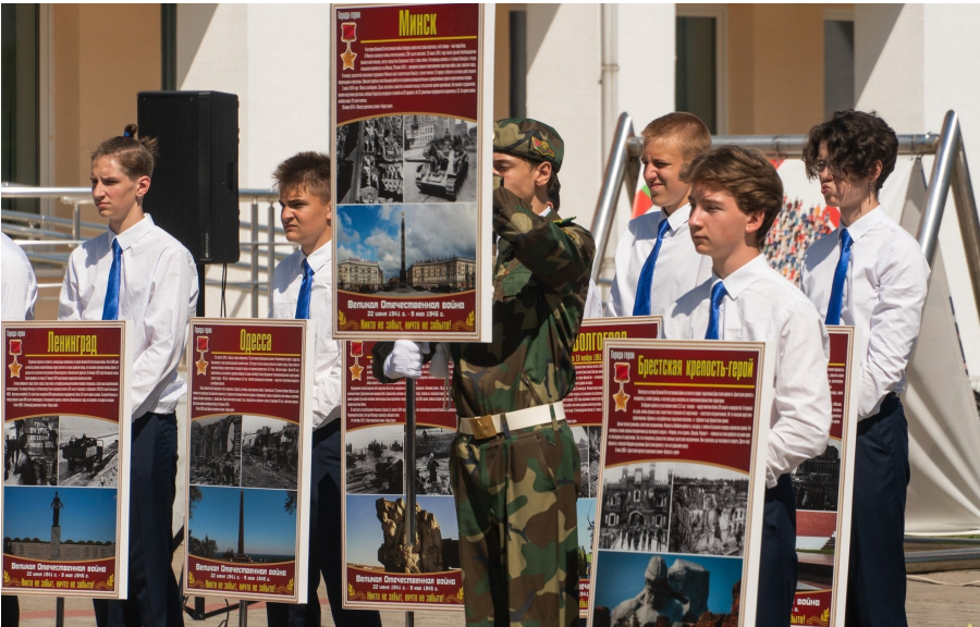
Во время репризы «Города-герои»

мени Победы. С тех пор, традиционно на всех мероприятиях гражданско-патриотической направленности осуществляется его вынос.