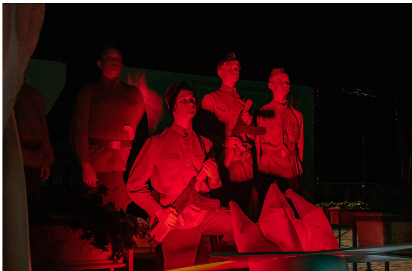
Реприза «Герои Брестской крепости»

На площадь выходят герои в военной форме, застывают в разных положениях «атака», «медсестра», «в бой» и др. В это время «за кадром» происходит озвучивание героев.