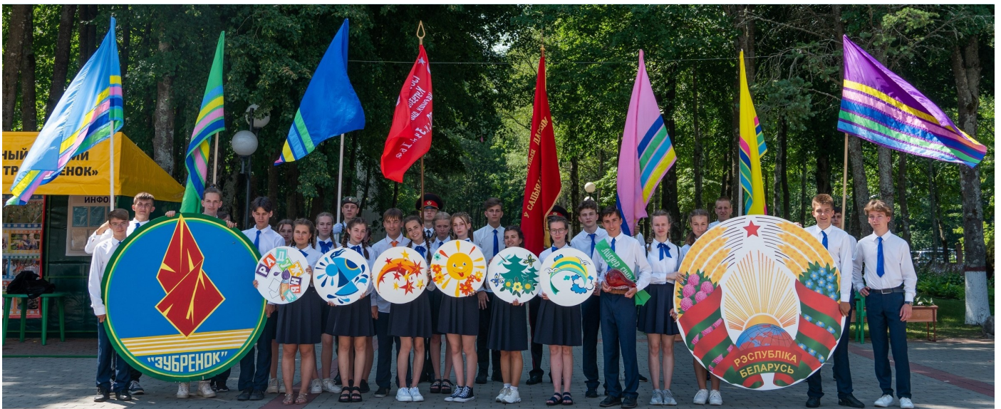
Участники торжественной линейки «Наши символы – наша гордость»

(участники репризы выстраиваются возле скульптурной композиции)