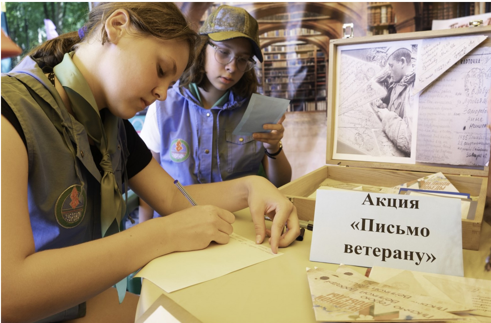
Акция «Письмо ветерану»

ные реликвии хранятся в заветных коробочках, узелках, папках. Они переходят от детей ветеранов к их внукам, от внуков к правнукам и это будет продолжаться всегда. Ведь эти письма, также как и награды ветеранов, для их семей являются настоящим наследством, памятью о родных, давно ушедших людях.