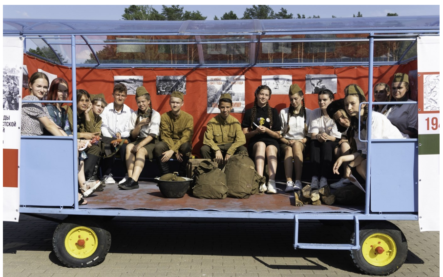
Участники мобильной агитбригады на передвижной платформе