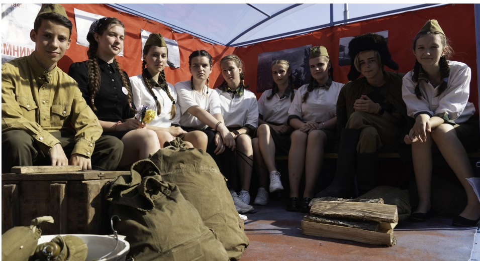
Участники военно-патриотического проекта «Мобильная фронтовая агитбригада» к 80-летию начала Великой Отечественной войны

Все. Благодарим, благодарим, благодарим.