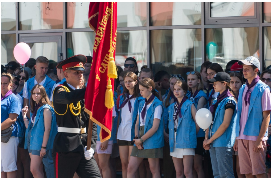
Вынос Почетного государственного знамени Республики Беларусь

Ведущий. 17 августа 2019 года «Зубренок» отпраздновал свой полувековой юбилей.